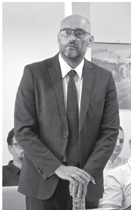
Расправа о девастацији Дудика

доначелника био је да треба наплаћивати паркинг и у Борову насељу да нико не би био у повлаштену статусу те да у градској управи нису упознати са споменутом грађанском активношћу. Став СДСС-а је да је петиција оправдана јер Град у том сегменту није имао значајних улагања, неки су ‘наслеђени’ из ранијих времена, а постоје и одређени још увек нерешени имовинско-правни односи, па би са наплаћивањем паркинга ипак требало причекати.