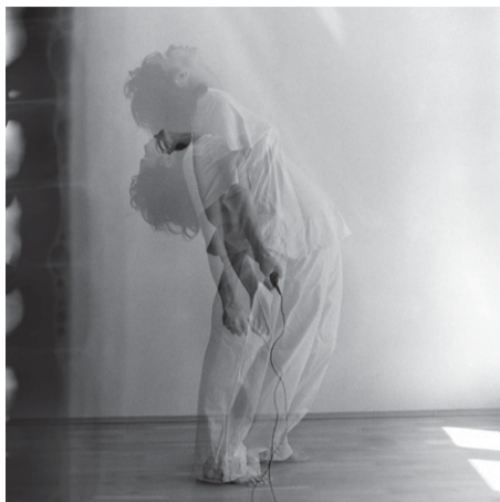
Potlačenost pretvorena u akciju