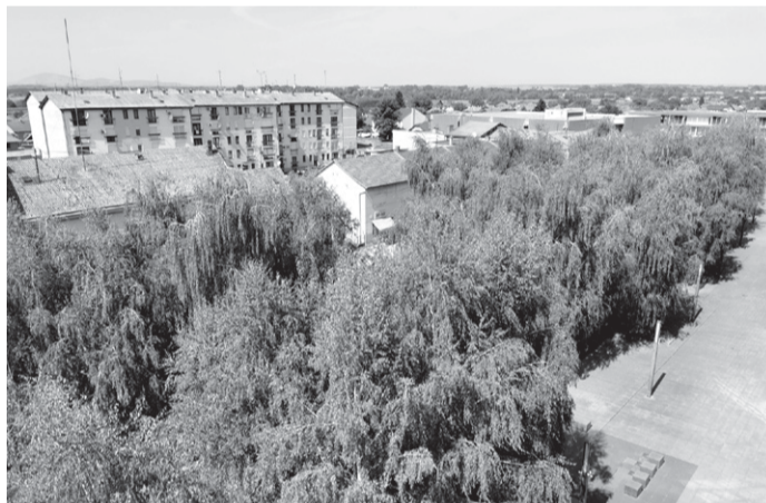
Брезе у центру Белог Манастира

зелених и водених површина које омогућују низ користи за становништво док истодобно пружају станиште за биљке и животиње. Под зеленим површинама овде се мисли на све јавне и приватне површине под вегетацијом (паркови, дјечја игралишта, шуме, ливаде, дрвореди итд.), укључујући и зелене кровове, фасаде и сл. Кружно господарење простором и зградама подразумева да се некориштени и напуштени простори и зграде приведу новом кориштењу, да се материјали настали рушењем таквих зграда рециклирају те да се нове зграде граде рециклираним материјалима и на начин да се осигура енергетска ефикасност, кориштење обновљивих енергената и оборинске воде те смањи производња отпада. Будући да се зелена инфраструктура и простор уопште планирају за становништво које у њему живи и користи га, из Града Белог Манастира овим су путем желели прикупити ставове, размишљања, потребе и жеље становника Града Белог