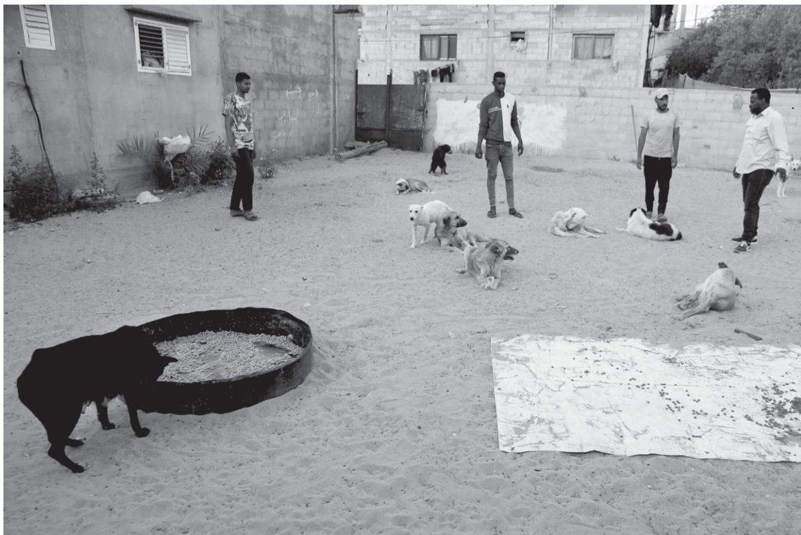
Said al-Ar, osnivač Sulala Animal Carea, hrani pse u dvorištu svoje kuće, svibanj 2024.

Ribari Gaze na internetu opisuju skriveni život životinja u najdražem im moru. Spominju divne susrete s dupinima, ali i dva kita koja su tijekom 1980-ih valovi izbacili na plažu u Gazi nakon što ih je najvjerojatnije ustrijelila izraelska vojska. Kao i u pogledu na kaveze u zoološkim vrtovima, u Gazi bijega od nasilja jednostavno nema. Pejzaž je to najpakleniji mogući, koliko god ga svakoga dana verbalno sanitizirali i eufemistički umivali. ■