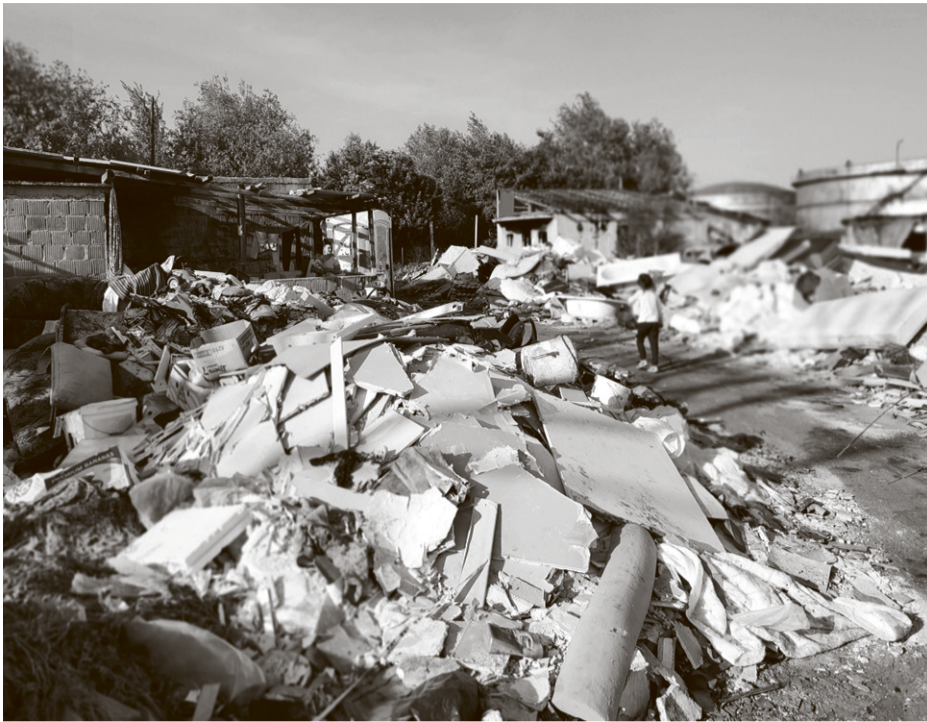
Naselje Struge iz kojeg su romske obitelji 2022. preseljene u prihvatilište u Kosnici i u hostel Arena