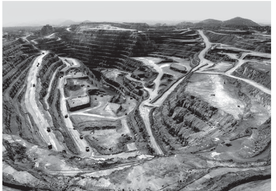
Nekadašnji rudnici Riotinto u Andalusiji.

Za Rio Tinto (ne za Riotinto!) sam saznao čitajući 'Embahade' MILOŠA CRNJANSKOGA. Kad su početkom osamdesetih objavljene, nas nekoliko se takmičilo da ih čitamo i da se naglas preslišavamo. Ondje je, u poglavlju o Španskom građanskom ratu spomenuto kako je Rio Tinto izišao u vijestima kad su se Engleska i Njemačka sporile oko sirovina, naročito oko gvožđa, te kako je Franco zaplijenio tu englesku firmu te je predao nekom njemačkom konzorciju što je izazvalo diplomatsku krizu. Danas mi je čudno da Crnjan-