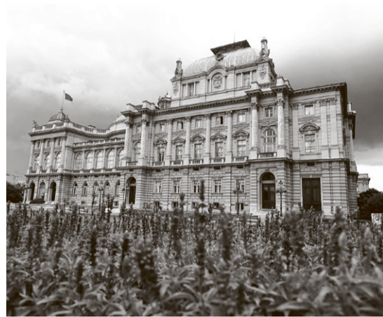
Хрватско народно казалиште, метафора повијести и визије националне културе

Нижу се те невјеројатне приче, пролазе деценије у хронолошки постављеним поглављима, а како се приближава оно што ишчекујемо са зебњом, што нужно мора доћи, али за што у оном времену, уза све дотадашње успоне и падове нашег града и међусобних односа који су били какви су били, ни у најгорим кошмарима вјеројатно нитко није могао претпоставити да ће се догодити након априла '41. Мучан примјер