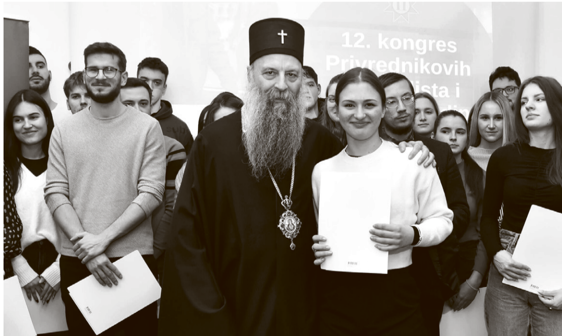
Прошлогодишња генерација Привредникових стипендиста с патријархом Порфиријем

Иако дефинисано као 'бесплатно', образовање кошта, и то прилично. Из године у годину крајем септембра и почетком октобра на Привредникову адресу стиже све више пријава на конкурсе за стипендирање. Прошле школске/академске године Привредник је стипендирао сто тридесет ученика и студената с подручја целе Хрватске. У Прерадовићеву 18 стигле су пријаве из Вуковара, преко Загреба, Ријеке, Карловца, Книна,... Из сваке те пријаве може се прочитати колико је образовање скупо. Многим недостижно. Али у свакој пријави, иако то нигде није директно наведено, ко уме да је прочита – може видети здрав систем вредности који цени образовање много више од нужних материјалних трошкова. У том систему образовање је вредновано као предуслов напретка, успеха. У свакој пријави, од оних у којима је документовано врло тешко материјално стање породице, па до оних скромних или просечних, у свакој одреда је