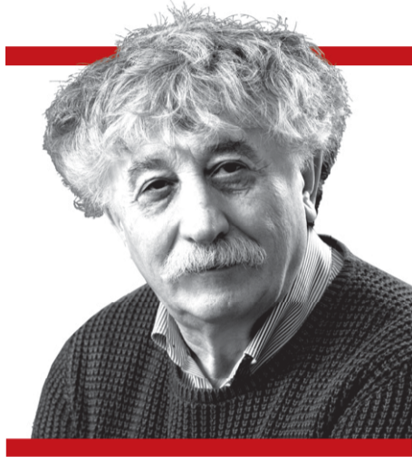
PIŠE Sinan Gudžević

Rio Tinto je britanska rudarska kompanija za koju oni što se bave zaštitom životne sredine tvrde da je zločinačka. U Španiju je došla 1873. i ondje načinila trajnu stravu u krajoliku i u dušama ljudi koje je izrabljivala kao rudare. Petnaest godina nakon uzimanja mjesta Riotinto, izbi-la je protiv kompanije Rio Tinto najveća ekološka i socijalna pobuna