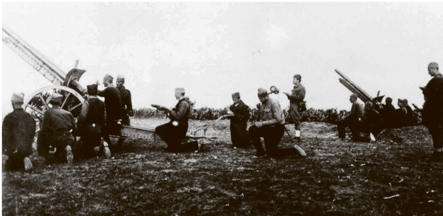
Artiljerijska baterija 23. srpske divizije u borbi protiv Bugara kod Lebana u julu 1944.

No do povećanja broja partizana u Srbiji nije dovela samo amnestija. Naglo povećanje posljedica je prije svega provedene mobilizacije. Mladići mobilizirani u Srbiji u velikoj većini nisu bili u četnicima, a oni koji su i bili, bili su u njihovom uglavnom prisilno