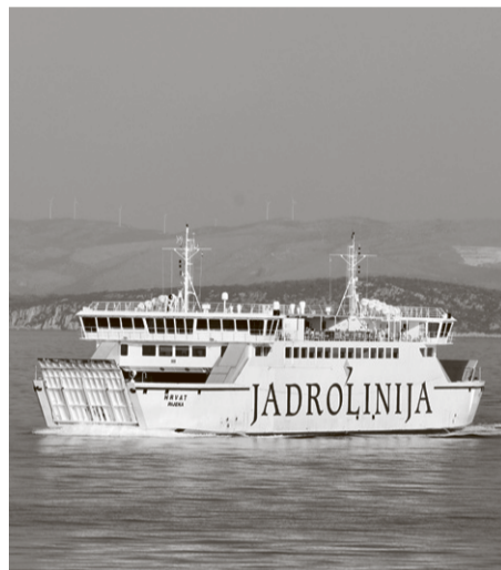
Katastrofalno stanje Jadrolinijinih trajekata

Ništa se tako nije promijenilo, osim što su britanske vlasti 1986. potpisale ugovor za izgradnju Eurotunela ispod La Manchea: u bespoštednoj borbi za opstanak na tržištu Townsend Thoresen uveo je dvadesetčetverosatne smjene s rekordno kratkim vremenom za ukrcaj i iskrcaj, a onda i nekakvu blesavu na gradnu igru, u kojoj su čitatelji tabloida 'The Sun' sakupljali kupone za jednodnevni izlet u