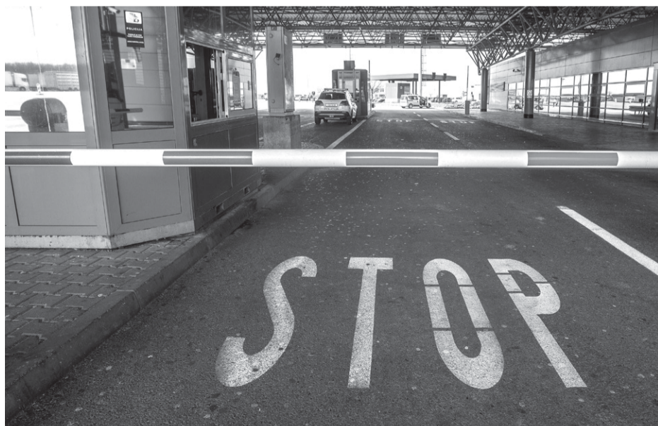
Srbija ima spiskove nepoželjnih osoba – granični prelaz Bajakovo