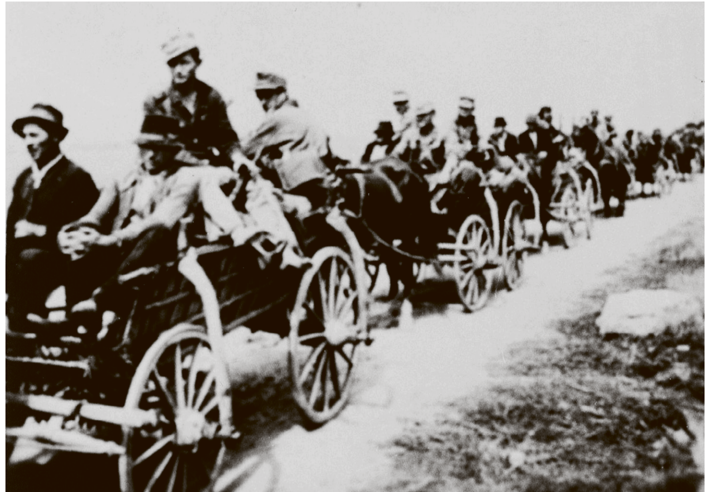
Domobranci koji su prešli u NOVJ u aprilu 1944. kod Tovarnika

Nakon što su 22. juna 1941. Sile osovine napale SSSR, vlasti NDH formirale su jedinicu poznatu kao 369. pojačana pješaka pukovnija. Mesić je u toj jedinici, koju je opremio, obučio i pod svojom neposrednom komandom imao Wehrmacht, imenovan komandantom artiljerije. S jedinicom se borio na istočnom frontu, a od septembra 1942. godine i u samom Staljingradu. Nakon smrti komandanta pukovnije VIKTORA PAVIČIĆA krajem siječnja 1943. godine (prema nekim izvorima Pavičić je ubijen u obračunu kada se pokušao ukrcati u jedan od posljednjih njemačkih aviona koji je poletio iz Staljingrada), Mesić kao najstariji po činu preuzima komandu. U tom je svojstvu formalno predao pukovniju Sovjetima početkom februara, nakon završetka staljingradske bitke. U Zagrebu su ga kao mrtvog ožalili i odlikovali, no on je, zajedno s još 700 pripadnika pukovnije, preživio bitku. Poslani su na marš u logor Krasnogorsk u koji stiže njih oko 400 preživjelih. Sovjetske vlasti su mu ponudile, a on je prihvatio da prijede na stranu saveznika i bude na čelu jedinice koju bi osim preživjelih pripadnika Legije činili i građani Kraljevine Jugoslavije koje je rat zatekao u Sovjetskom Savezu i Iranu. U zamjenu su pušteni iz zarobljeništva. Osim zaro-