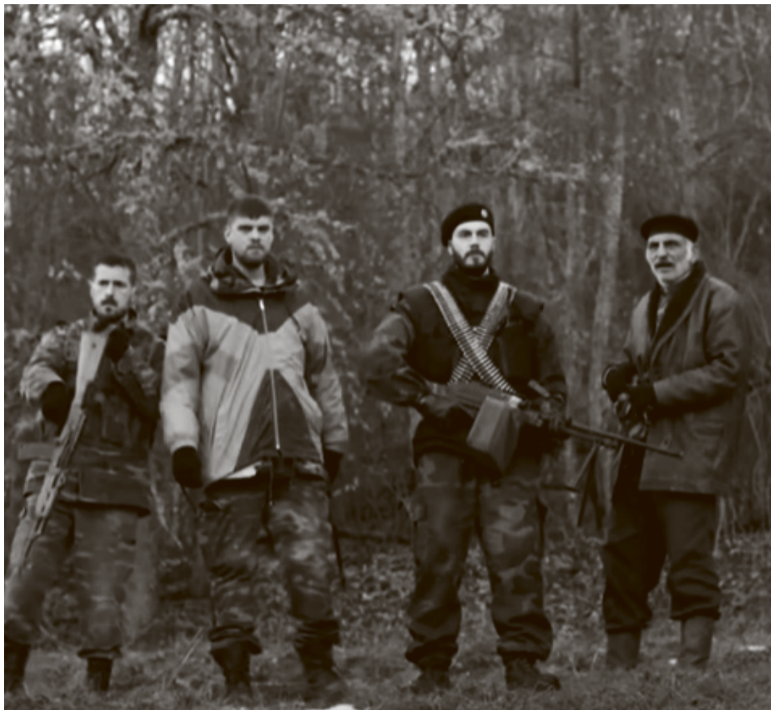
Кадар из трејлера серије 'Насер'