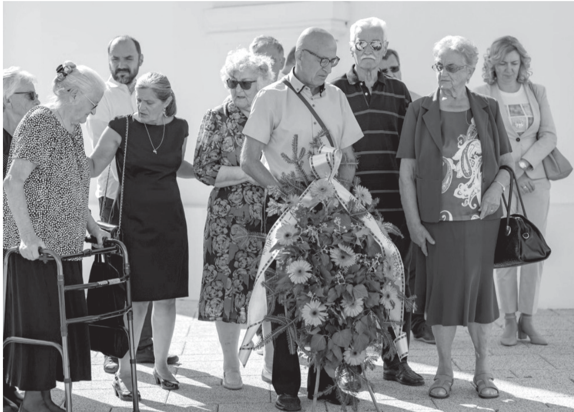
Представници СДСС-а с обитељима несталих