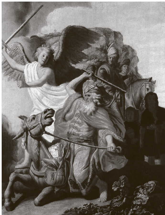
Rembrandt van Rijn: 'Bileam i magarac'

Osim u desničarskim medijima i na lokalnim razinama, sukob je izvjestan i u Saboru. Oduzme li se Biloglav iz saborske većine, ona će biti smanjena na graničnih 76 zastupnika. S druge strane, moguće je da će tri bivša zastupnika DP-a ući u savez s desničarima koji su ih se odrekli zbog koalicije s HDZ-om. Radi se o četiri do pet potencijalnih zastupnika, od Jurčevića do VESNE VUČEMILOVIĆ, što znači da bi skupa mogli imati približno jednak broj ujedinjenih zastupnika kao i DP. Svi članovi DP-a koji su ostali, s naglaskom na likove poput Penave i Mlinarića, zaslužili su obilje najgorih napada koji će ih iz suprotnog tabora neminovno snaći u narednim mjesecima, jer su godinama emitirali iste količine mrzilačkog sadržaja. Kada bi se obje strane u sukobu oslikalo jezikom umjetnosti Biloglava i Bujanca, nastao bi jedinstven portret. Hulje na platnu. ■