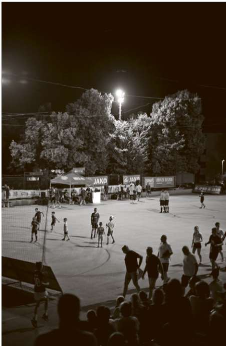
Malonogometni omladinski turnir u Kninu

— Stalno se ističu negativne stvari oko Kina, a u gradu se puno toga pomiče nabolje, pogotovo u zadnje vrijeme. Hrvatska se gleda samo prema obali, a toliko je ljepote ovdje. I mi ulažemo puno truda, puno volonterskog rada i entuzijazma da stvorimo i održimo društveno vrijedne programe u gradu, valjda bi se i o tome trebalo u medijima pisati – govori Katarina.