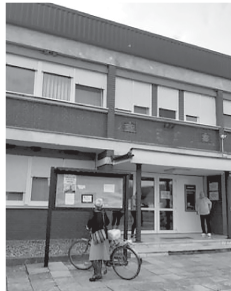
'Бесплатна правна помоћ' у Борову

зе структурирани разговори те основна и специјализована едукација. Специјализована ће бити на тему оврхе и овршног поступка те права странака. Биће одржане три Караване, путем којих ће бити подељен промотивни материјал и одржани састанци са представницима институција и организација.