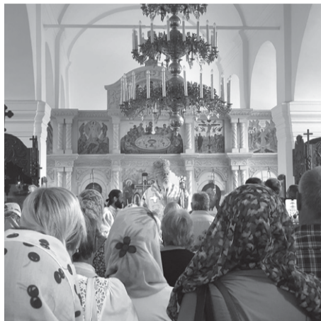
Велика Госпојина у манастиру Лепавина