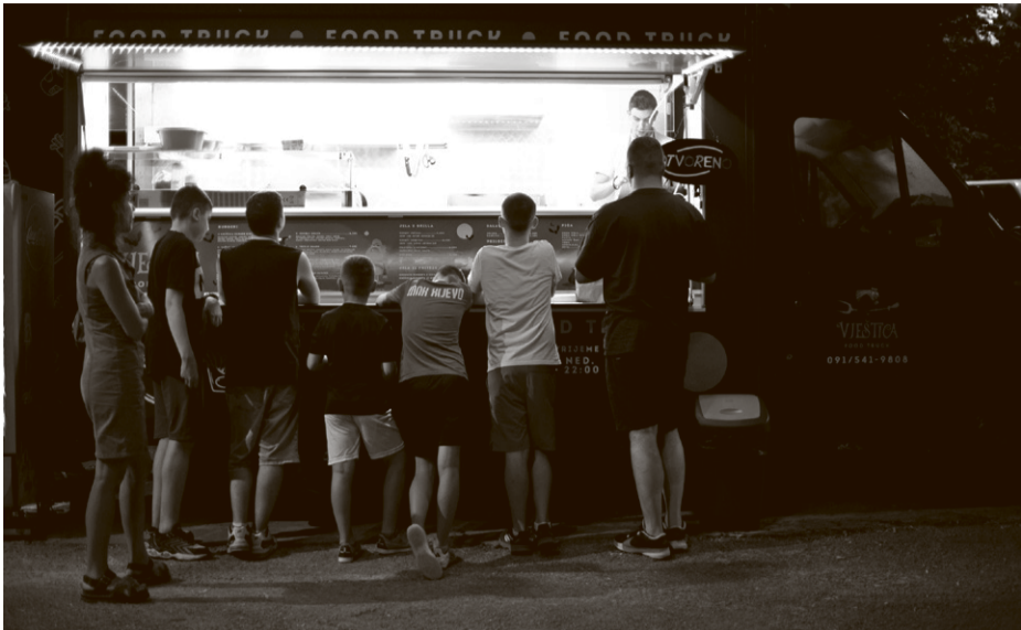
Nova atrakcija u gradu – food truck 'Vještica'

a od ove godine snimamo i podcast s bendovima – nadovezuje se Katarina.