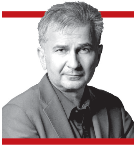
PIŠE Boris Rašeta

Prva epizoda 'Otpisanih' je genijalna, a opet je sve dio izmišljenog narativa na kojemu su odrasle generacije jugoslavenske djece. To da su 'otpisani' u Beogradu pobili više nacista nego Rusi kod Kurska je plod mašte: u Beogradu je palo manje vojnika Wehrmachta nego kauboja kod O. K. Corrala, ali tko šiša činjenice