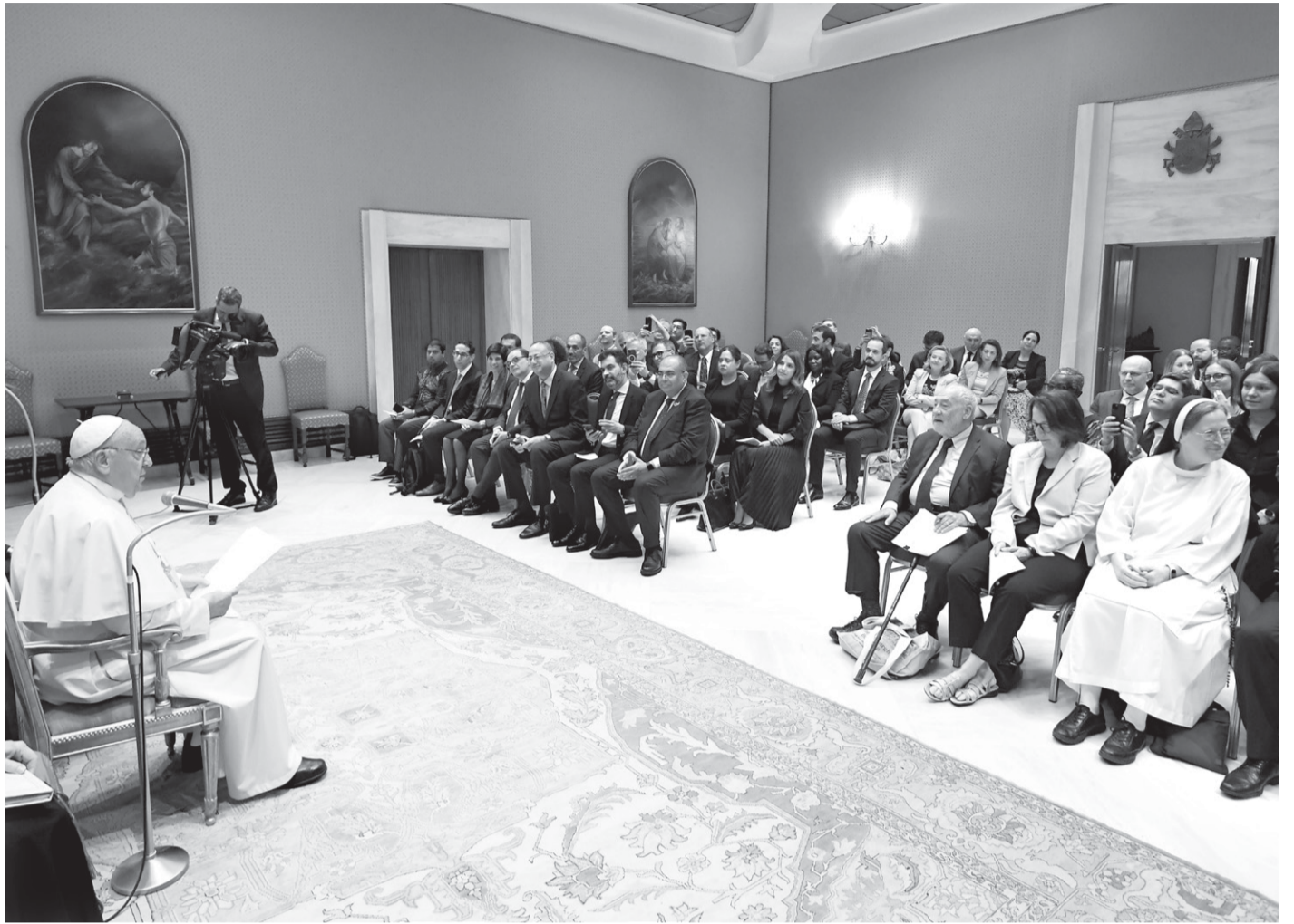
Papa Franjo sa sudionicima sastanka o dužničkoj krizi na globalnom jugu u lipnju u Vatikanu

25 afričkih država (od rekordne 54 zemlje u razvoju) na kamate na kredite danas troši deset ili više posto svojih godišnjih prihoda.