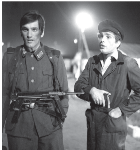
Dragan Nikolić i Vojislav Brajović u digitalno obnovljenoj seriji 'Otpisani'

T ONČICA ČELJUSKA jedina je među 2.500 zaposlenih na HRT-u koja je imala normalnu mladost! Svi drugi rođeni su u paklu ili u 'Hrvatskoj godine nulte' – 1991.! Čeljuska nema kompleksa. U svoj film dosad je pozvala bezbroj umjetničkih i estradnih ličnosti bivše Jugoslavije – kod nje su gostovali SVETLANA BOJKOVIĆ, zvijezda 'Boljeg života', VLATKO STEFANOVSKI, SAŠA ZALEPUGIN, VELIMIR SRIĆA, MIKI MANOJLOVIĆ, RADE ŠERBEDŽIJA... Tončica opušteno razgovara s idolima naše mladosti, ikonama jedne velike kulture koja je danas,