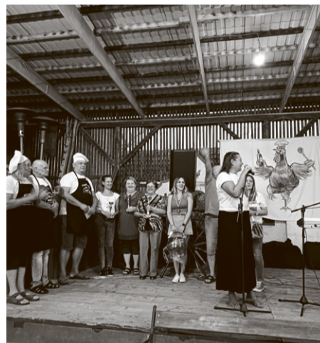
Побједнице у кухању пилећег паприкаша и спремању трганаца