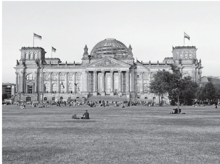
Demokracija u sumrak – Bundestag

Nacrt takozvane Rezolucije Bundestaga za zaštitu jevrejskih života u Njemačkoj, sada radnog naslova 'Nikad više je sada: Zaštita, očuvanje i jačanje jevrejskog života u Njemačkoj', već od prošle godine izaziva snažne reakcije javnosti, o čemu su izvještavali mnogi njemački mediji. Kao zajednički dokument SPD-a, Zelenih, FDP-a i CDU-a, Rezolucija je trebala biti usvojena već