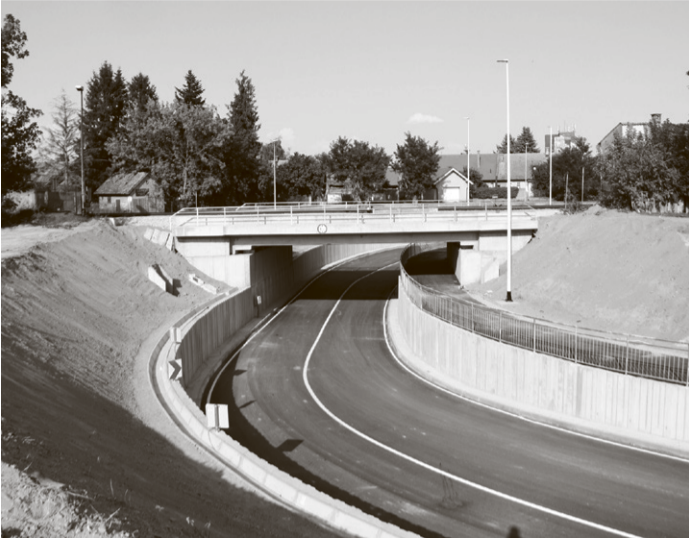
Обновљени подвожњак у Белом Манастиру