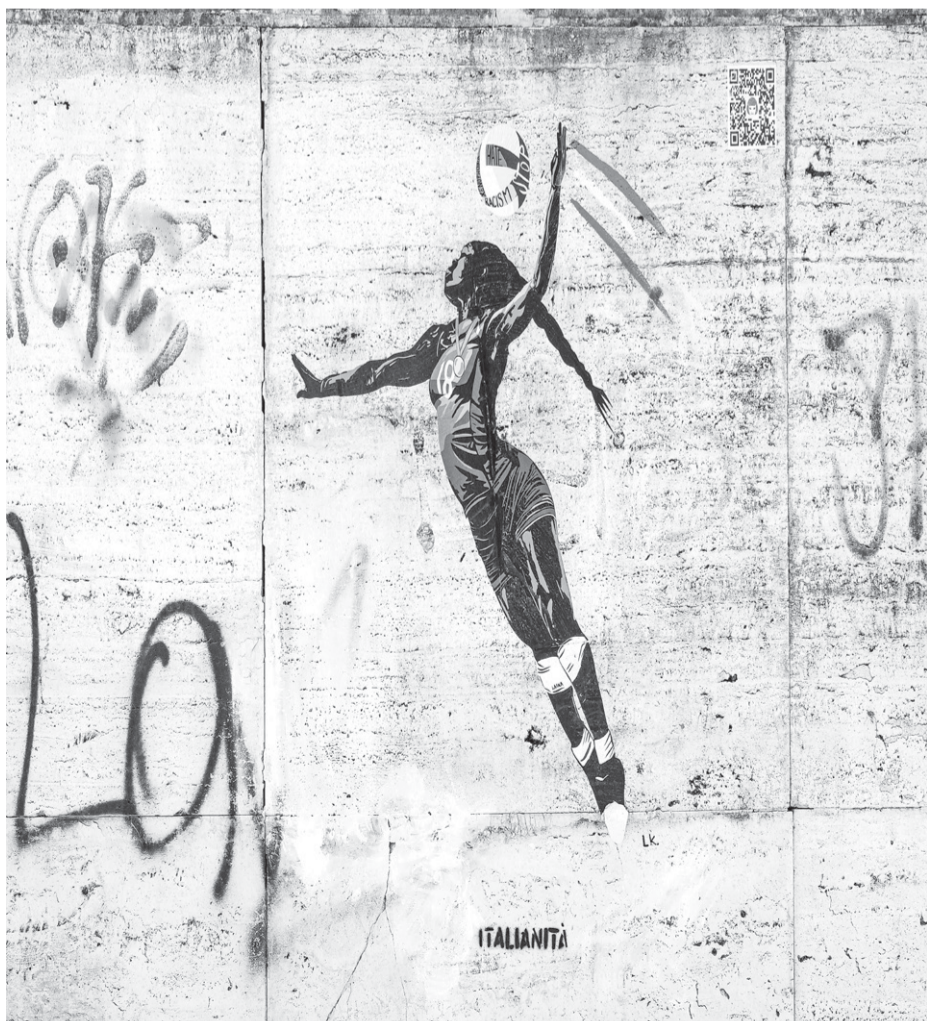
Mural posvećen Paoli Egonu