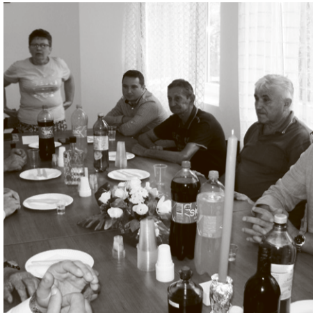
Свечана сједница ВСНМ-а Града Слуња