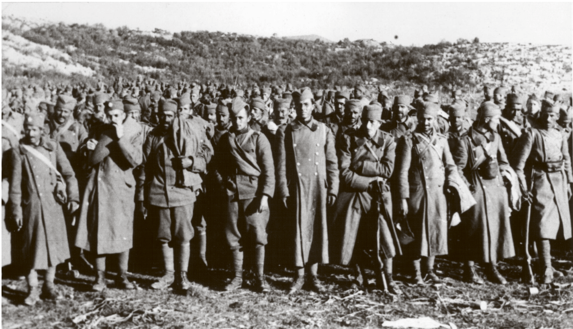
Југословенска краљевска војска после капитулације 1941.