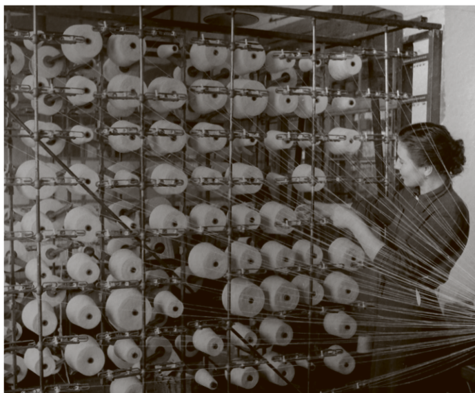
Izložba Sanje Iveković 'Nada Dimić – Rekonstrukcija industrijskog naslijeđa'

povećanja plaća, porodičnog dopusta i urednijeg radnog vremena. Dajte nam da radimo, samo nas pošteno platite, ali ne i da odbijemo rad koji nije direktna podrška jednih drugih, nego koji i dalje služi ekstrakciji vrijednosti. Dokidanje najamnog rada, a onda i kućanskog i skrbničkog rada kao mjesta reprodukcije proizvodne snage, zanemareni su odlomci marksističke literature na kojoj su se i Dimić i Butorac radikalizirale. U suvremenim postjugoslavenskim državama, kada se zatire i minimum, temeljno dostojanstvo radništva, ta se predodžba rada, a s njime naknadno i Nade Dimić i Anke Butorac,