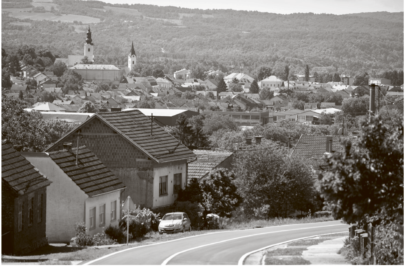
Pogled na Pakrac

Kao presudan za opstanak ovdašnje srpske zajednice mnogi sudionici fokus-grupe vide SPC: Smatraju da ima veliku ulogu za narod, 'lijepo je kad se okupimo na Badnjak'