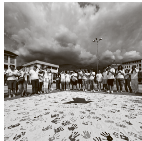
Млади за мир