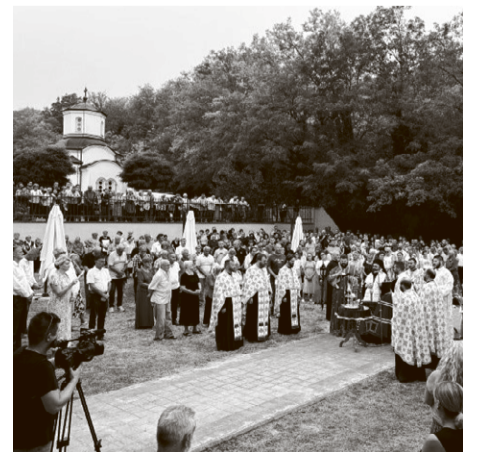
У манастиру Успења Пресвете Богородице

— Овај празник спада у највеће празнике Господње, празнике који су посвећени Господу Исусу Христу, који су посвећени догађајима из његовог живота. Тих празника се сећамо, не само као дела историје и прошлости, већ у тим догађајима из живота Христа и учествујемо, својим присуством на светој литургији – рекао је, између осталог у беседи, јереј Кузмановић.