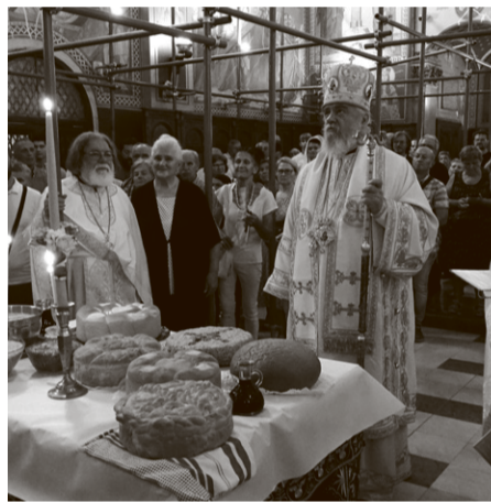
Празник Преображења у Загребу

лијеже смрти и пропадљивости – рекао је владика Кирило.