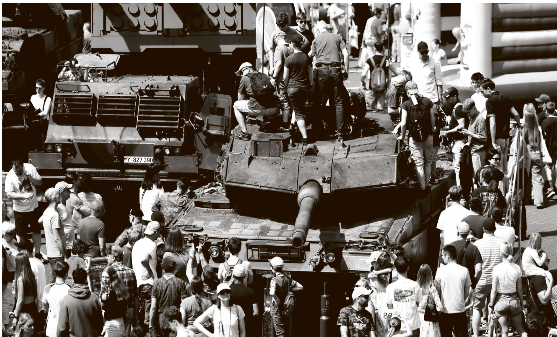
Njemački tenk Leopard 2 izložen na ovogodišnjem danu njemačke vojske