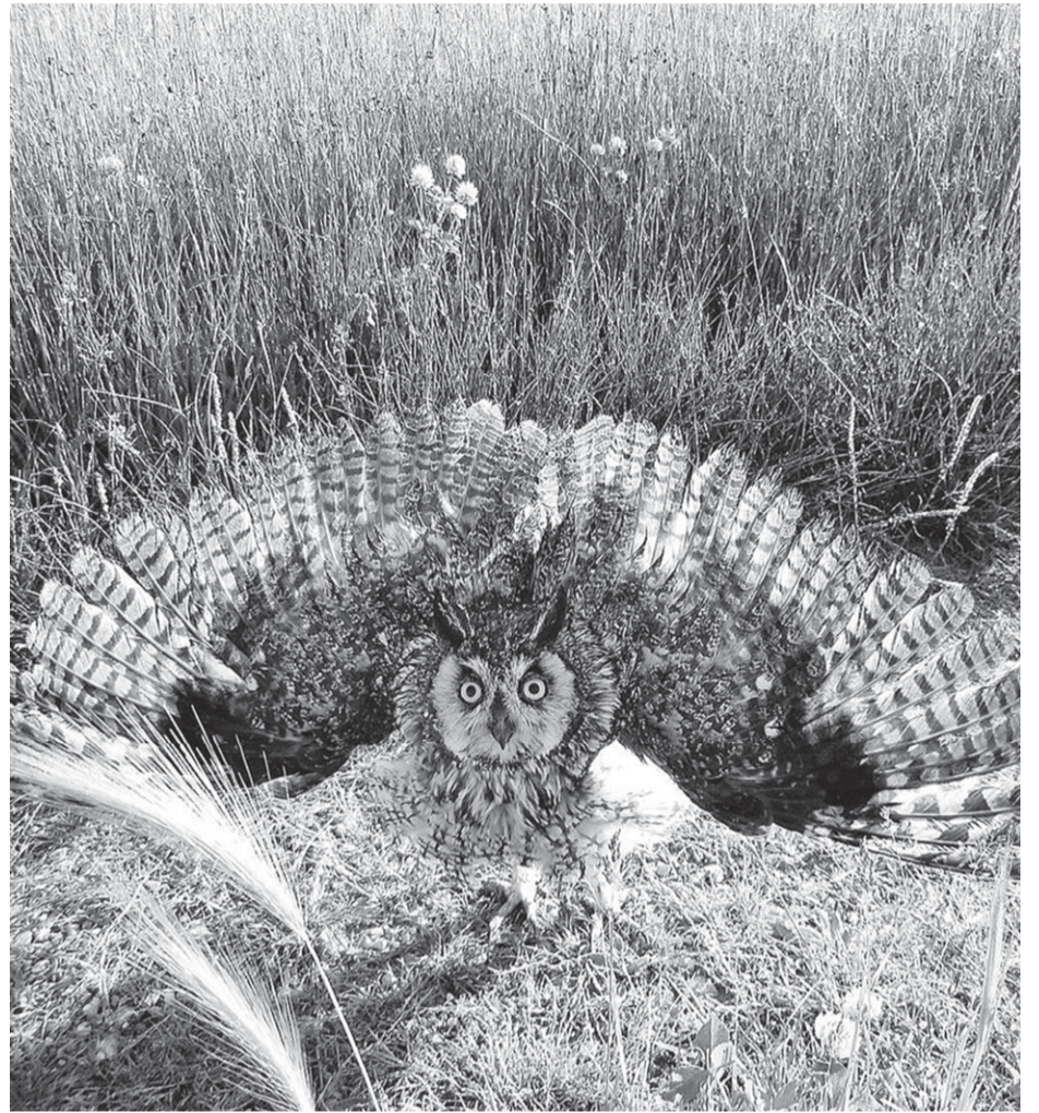
Mlada hutina.