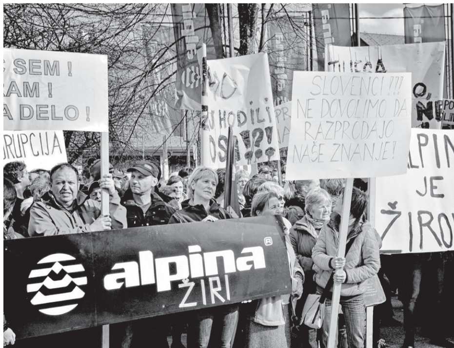
Овако је било 2016. – просјед против затварања погона Алпине у Жирију

Слављење Алпининих кључних елитно-нишних успјеха тешко да ће бити дугорочне нарави, али свакако ће потрајати докле год се даде зарадити на исцрпљивању јефтине радне снаге све даље и даље од Словеније. У Словенији ће у међувремену остати само потплаћене раднице у трговинама Алпине које уз више него квалитетну обућу, суштински продају носталгију. Носталгију за снијегом који пада сваке зиме и скијањем доступном народу, за Алпином на свачијој нози и радничким правима у свакој кући. Па закључимо и ту белу симфонију с Лачним Францом: Лахко си обршиш нос в мојо срајцо, драга / Не морем веч гледати твојих солзних очи. ■