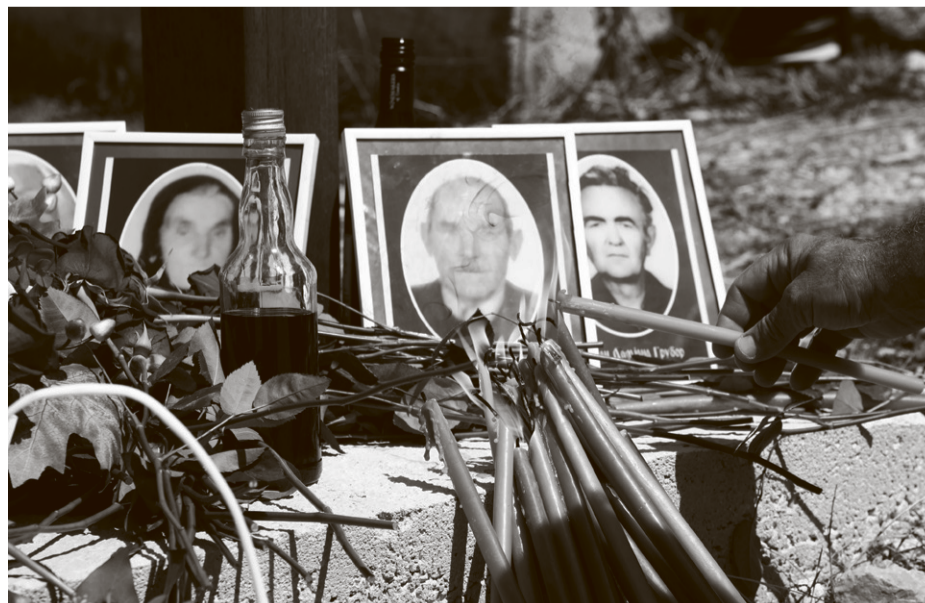
S komemoracije u Gruborima

Državni vrh, predvođen predsjednikom ZORANOM MILANOVIĆEM i ministrom TOMOM MEDVEDOM , tek je 2020., na 25. godišnjicu zločina, otišao u Grubore pokloniti se žrtvama, a tada je započeta i obnova u međuvremenu napuštenog sela. Naredne godine MILI GRUBORU , jednom od članova porodica ubijenih koji su podnijele zahtjev za obeštećenjem zbog duševne boli izazvane smrću srodnika, na naplatu je stiglo 35.000 kuna sudskih troškova zbog izgubljenog spora. Frano Drljo , Božo Krajina i Željko Sačić u međuvremenu su pak dobili pozamašne svote na ime oštete za vrijeme koje su proveli u istražnom zatvoru, pa potonji preko društvenih mreža ovih dana nonšalantno poručuje: 'Poginulim, nestalim i umrlim na putu za našu slobodu neka je, uz milost Božju, vječni mir i neprolazna slava i hvala. A nama živima bolja Hrvatska, zaslužili smo je!' ■