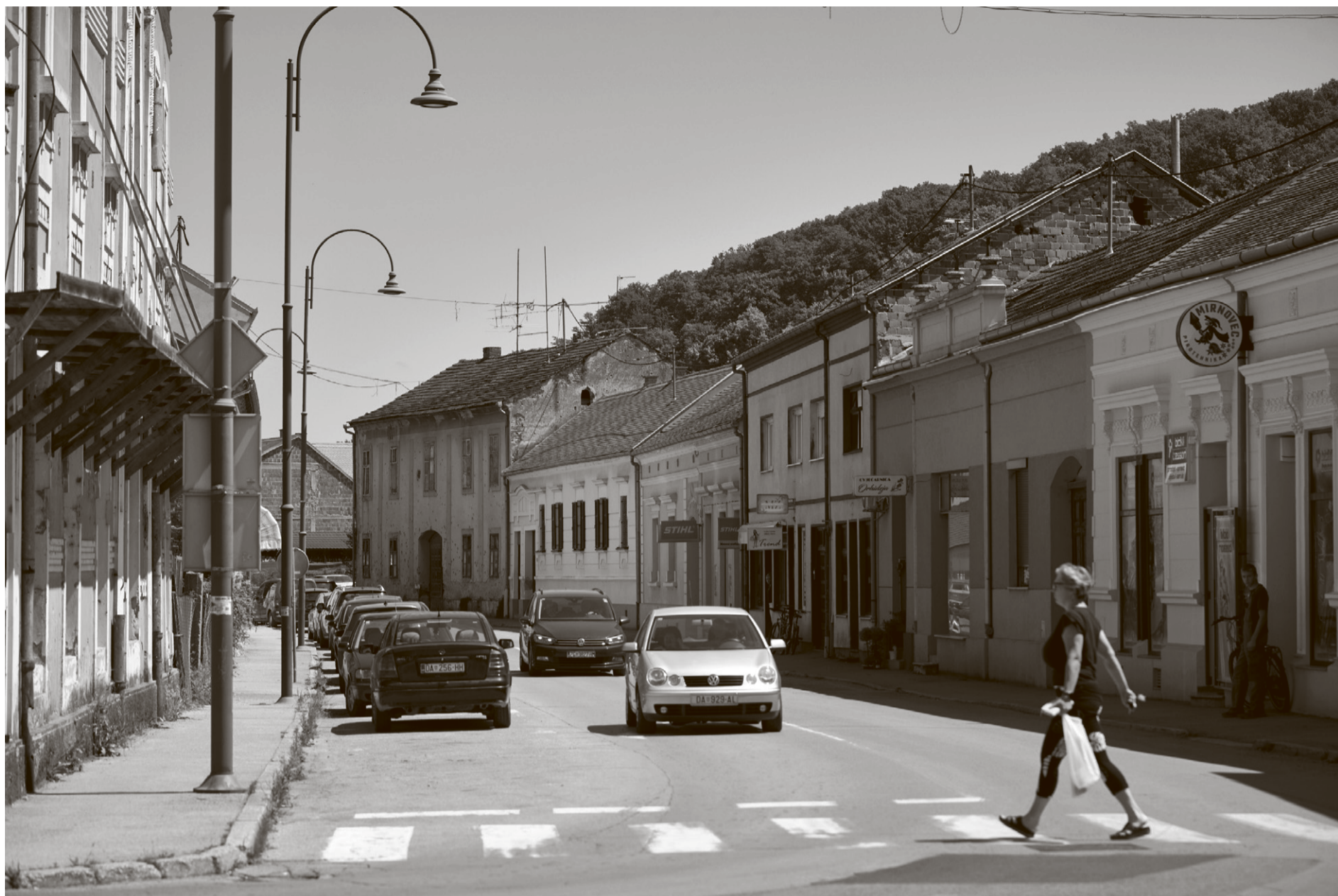
U deset godina grad je izgubio 16 posto stanovništva